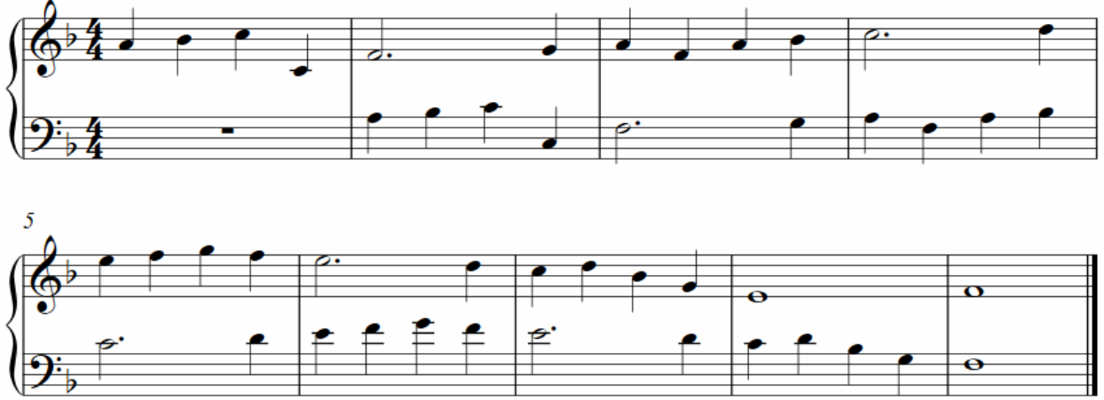
شكل رقم (١٠)