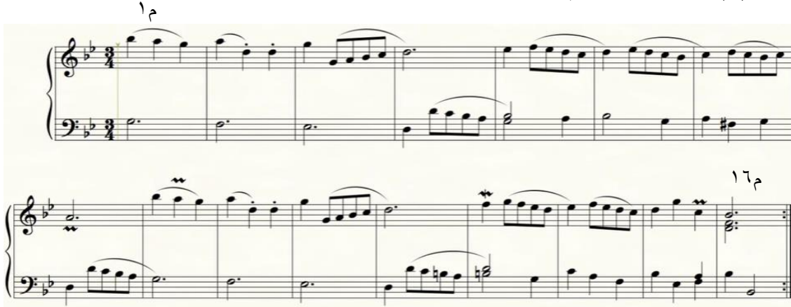
شكل رقم (٤)