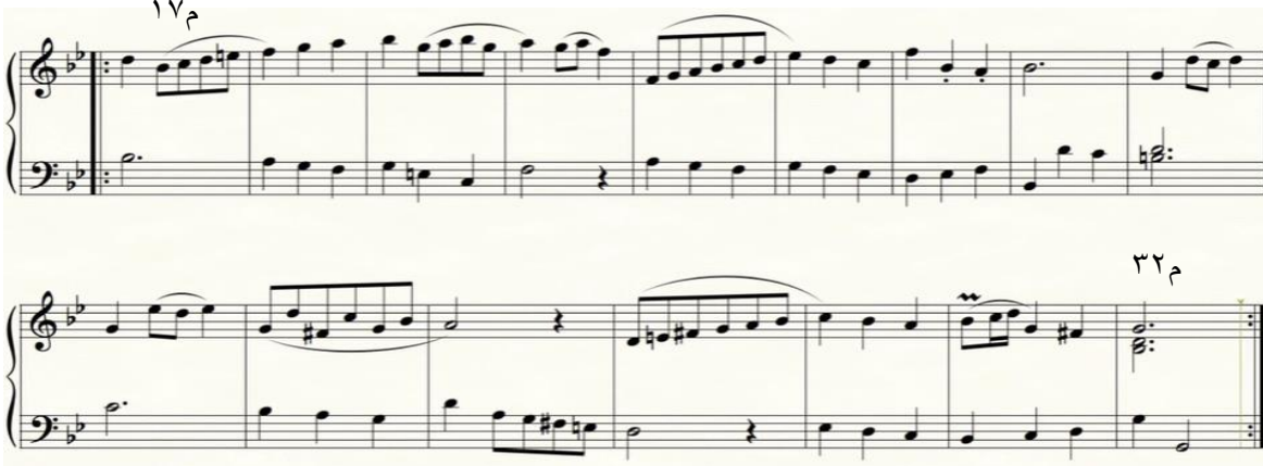
شكل رقم (٥)

تكون الفكرة الثانية أيضاً من جملتين منتظمتين