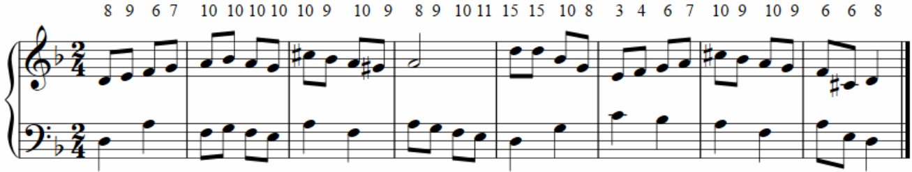
شكل رقم (٧)