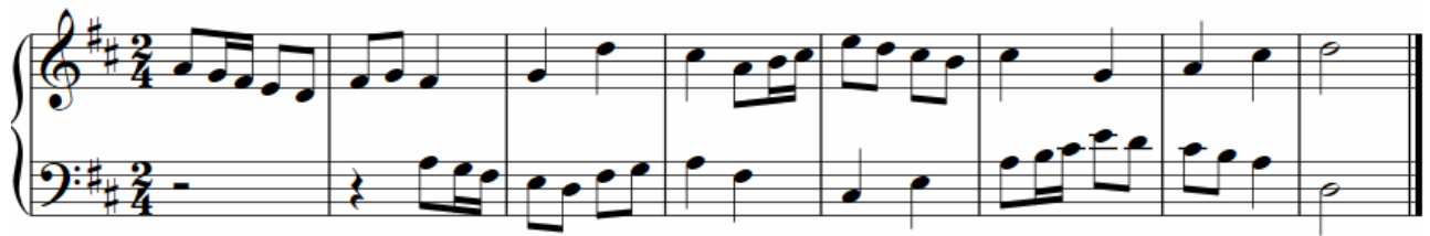
شكل رقم (٩)